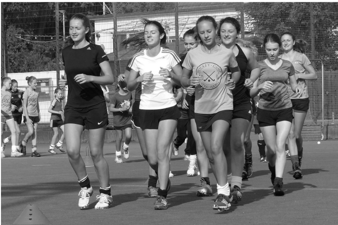
Augen zu und durch!